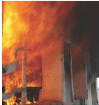
Essais Ad Hoc