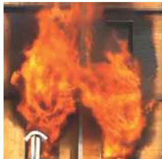
Essais feu façade